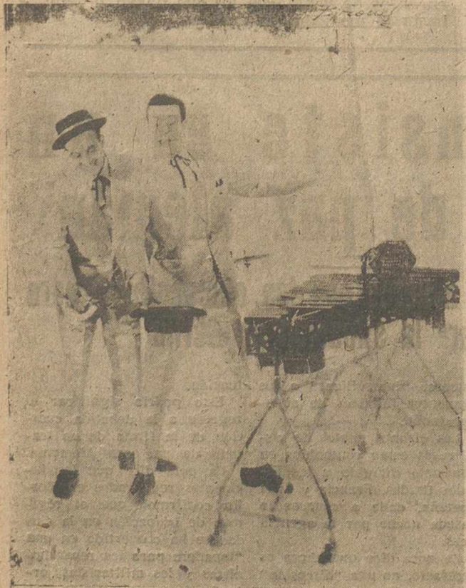
Que actuarán en la Caseta de los Jardinillos, durante los días de Feria.