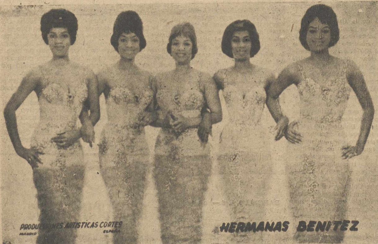
PRODUCTORES ARTISTICAS CORTES