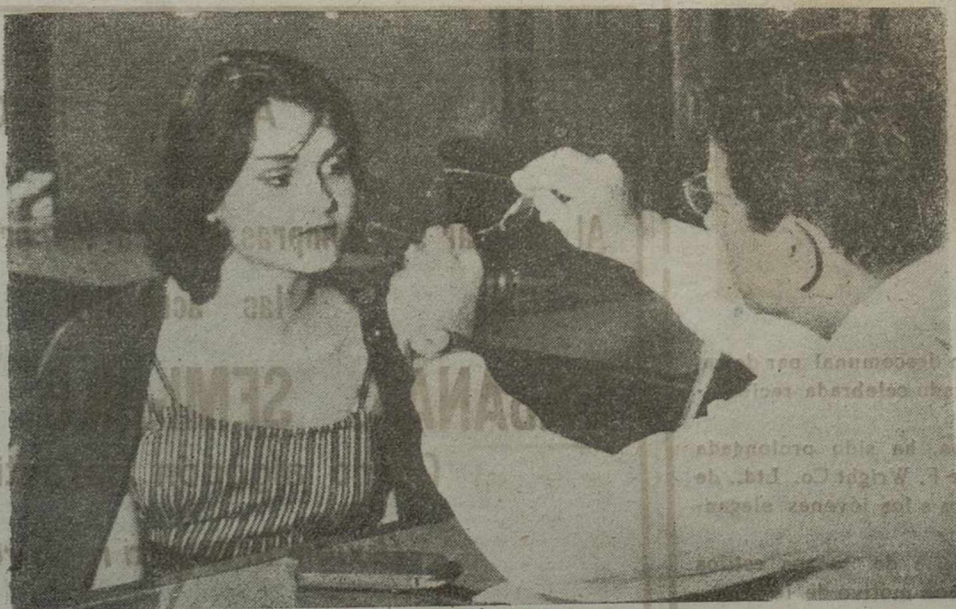
El óptico comprueba si los lentes han quedado bien montados. Una ligera desviación del centrado, o unas varillas inexactas, podrían restarles eficacia, e incluso hacerlos nocivos.