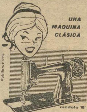
UNA MAQUINA CLASICA

El "Día del Cáncer" en Albacete, que se celebra mañana, debe ser y será un jalón más para esa Junta Provincial de la Asociación, a la que adelantamos la seguridad del éxito de su postulación, porque sabemos que los albacetenses siempre responden cuando se les llama al corazón para la realización de altas empresas.