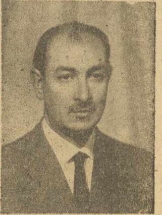
Don Mariano Navarro Rubio, designado por S. E. el jefe del Estado para el cargo de ministro de Hacienda, era en la actualidad subsecretario de Obras Públicas y, anteriormente, desempeñó altos cargos en la Organización Sindical.