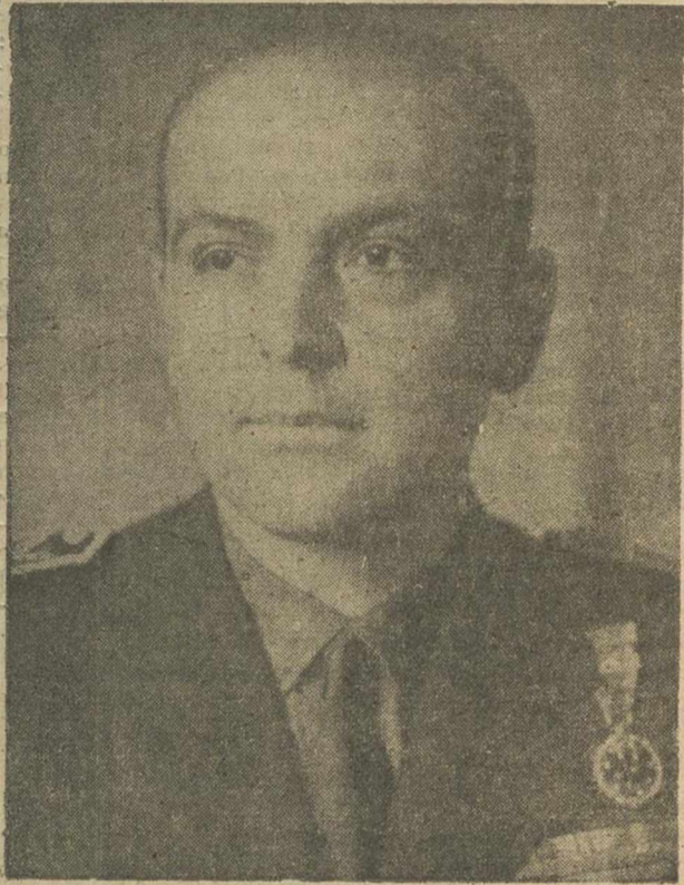
Don José Solís Ruiz, que en la amplia reorganización ministerial de ayer, ha sido designado por el Caudillo nuevo ministro secretario general del Movimiento. Hasta ahora había desempeñado, durante varios años, el cargo de delegado nacional de Sindicatos.

El teniente general Alonso Vega correspondió con unas palabras de agradecimiento por el elogio tributado por su antecesor, al que calificó como hombre de gran corazón, culto, trabajador y con una profunda lealtad. "Le conozco muy bien—dijo—porque estuve once años a su servicio como director de la Guardia Civil". Terminó diciendo: "sean mis pensamientos para el Caudillo que con mano firme, estoy seguro de ello, llevará a España por la ruta que aconsejen las circunstancias".