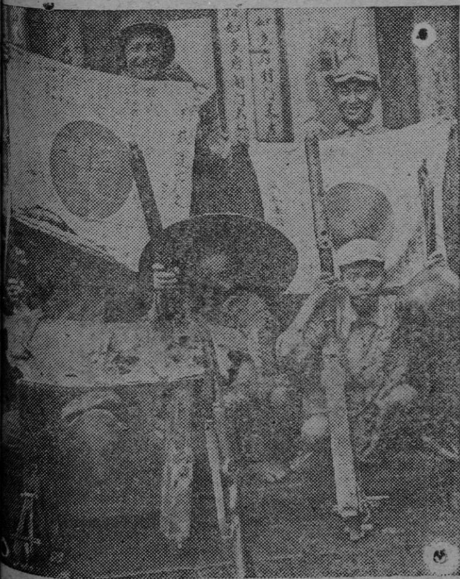
Los aliados muestran las banderas de combate, tales como las de las tropas, armas y cascos, capturadas en la antigua ciudad de Tanchung.

Un radio escucha de Salda Badeira ha enviado a la emisora lusitana la sugerencia de que Portugal y su Imperio podrían también salvar muchas criaturas de este destino trágico y el mismo se ofrece para acoger 10 de esos niños, que serán tratados— dice — como sus propios hijos.