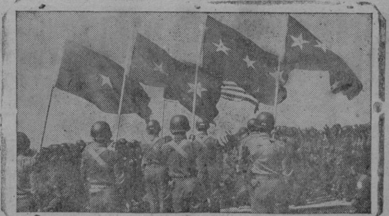
Banderas de una, dos, tres y cuatro estrellas ondean durante la revista de una división norteamericana de aerotropas