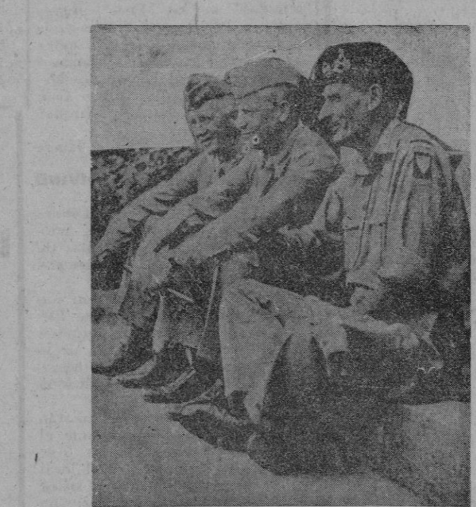
El general Eisenhower, jefe supremo de los aliados con el general Montgomery jefe de las fuerzas británicas y el general Bradley, jefe de las fuerzas de los Estados Unidos

"Tropas de las fuerzas expedicionarias aliadas han realizado un desembarco esta mañana en la costa de Francia, desembarco que constituye parte del plan concertado por las Naciones Unidas para la liberación de Europa, realizado en combinación con nuestros grandes aliados rusos. Tengo que daros este mensaje. Aunque quizá no se haya realizado el asalto inicial en nuestro país, se aproxima la hora de vuestra liberación. Todos los patriotas, hombres y mujeres, jóvenes y viejos, tienen un papel que desempeñar en la consecución de la victoria definitiva. A los miembros de los movimientos de resistencia, estén di-