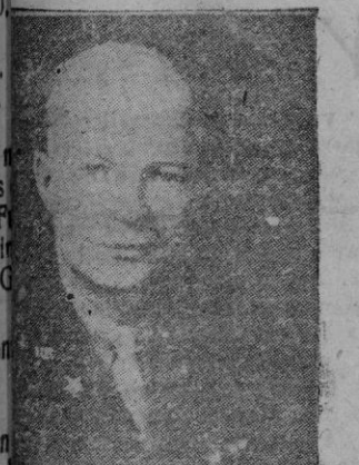
General Eisenhower, jefe de las tropas aliadas

des, el enemigo se cubrió de niebla artificial, ayudados por numerosos aviones que volaban muy bajos sobre el mar, dejando tras de sí una espesa columna de niebla. Las unidades alemanas se aproximaron audazmente a esta columna de niebla y lanzaron contra el adversario todos sus torpedos y todos los proyectiles de su artillería. El enemigo estaba tan concentrado que debe haber experimentado graves daños por la acción de nuestros torpedos y nuestra artillería. A pesar del fuego concentrado de la artillería adversaria, nuevas unidades no cesaron de combatir, hasta que vieron agotadas todas sus municiones. Sin haber tenido pérdidas, nuestros buques han alcanzado una base alemana. Otras unidades de protección alemanas, entablaron combate con formaciones enemigas muy superiores, que se encontraban a lo largo de la desembocadura del Sena y combatiéron encarnizadamente no obstante la superioridad numérica del enemigo. En este combate fué hundido un buque alemán. Las baterías costeras de la marina de guerra y del ejército han participado en los combates. Una batería de la marina hundió una gran unidad enemiga y provocó otras pérdidas del adversario. Es probable que el enemigo haya sufrido más daños, pero no han podido ser observados a causa de la niebla.