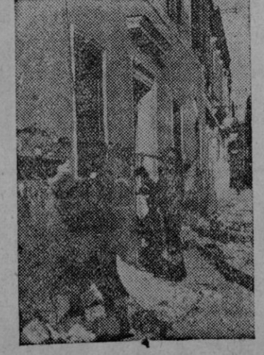
Quitando mi'as. - Ingenieros norteamericanos quitando las cargas explosivas ocultas por los alemanes en las paredes de los edificios de Anzo

Londres. — Motivado por la escasez de cartas procedentes de los prisioneros de guerra británicos que fueron transferidos de Italia a Alemania, James Grigg, ministro de la Guerra británico, ha protestado enérgicamente cerca de las autoridades alemanas por medio de la potencia protectora.