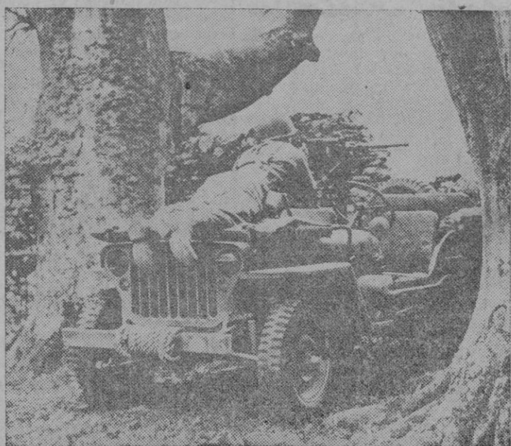
Tropas norteamericanas esta cionadas en Gran Bretaña realizando maniobras en condiciones análogas a las del frente

LOS ACTOS DE LA TARDE Después de comer, el Ministro visitó la Casa de Flechas que se construye en la Alameda de Oviedo, que será uno de los mejores edificios de Europa en su clase. A continuación, el Ministro se trasladó al vecino pueblo de Alceda, para visitar la Institución pedagógica "Micazo". Esperaban al Ministro, a la puerta de la Institución, el Director de la misma, el Vicepresidente de la Diputación y otras personalidades. El señor Arrese recorrió detenidamente todas las instalaciones y luego presenció en el campo de deportes algunas de las demostraciones físicas por los niños de la Institución. A su regreso a Santander, el señor Arrese presidió la inauguración de las viviendas protegidas construidas en la barriada de Peña Castillo. Se trata de 78 viviendas situadas en dos zonas y destinadas a familias modestas damnificadas por el incendio de Febrero. Esperaban al Ministro en Peña Castillo, el Prelado de la Diócesis, el Fiscal de Tasas y otras autoridades. Todo el vecindario de Peña Castillo se congregó para presenciar el acto. El Ministro Secretario General del Partido fué acogido con vitores a España y al Caudillo. El Obispo de la diócesis, revestido de pontifical, procedió a bendecir las viviendas, y acto seguido el señor Arrese, en unión de los señores Gobernador Civil y Militar, fué entregando las llaves de las casas a sus dueños. Terminado el acto, el señor Arrese regresó a Santander, siendo aclamado por el vecindario.