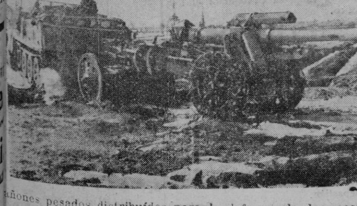
Armas pesadas distribuidas para la defensa de las costas euro-peas.

¡Adelante, mis Falanges Juveniles! Sobre vuestros años llenos de promesas se cierne el porvenir de España, de una España grande y justa, ordenada y creyente. Esto es lo que quiere decir vuestro lema "Por el Imperio hacia Dios".