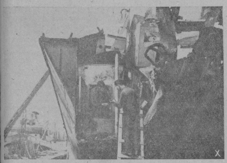
Un astillero flotante. — Una unidad de una escuadrilla de la Marina pesquera de guerra fué averiada. Los daños son reparados directamente al frente por los hombres del buque taller.

Ni reivindicaciones territoriales, ni razones económicas son las que hacen restallar el látigo de la guerra sobre la faz del mundo. Aquéllas y éstas pueden haber sido el motivo próximo, inmediato. Mas la razón interna, como dijo sapientísimamente el Caudillo, no se ha de buscar en los problemas territoriales ni de política interna. El problema universal había de plantearse cruentamente desde que se hallaban frente a frente dos concepciones políticas opuestas. Así planteada la cuestión se lucha hoy por conservar o destruir la civilización, la cultura; los conceptos nuestros de familia, de estado, de creencias religiosas. Se trata de la subsistencia de la vida espiritual de la Humanidad. Y como esa concepción espiritual es esencialmente nuestra; es el tuétano que informa nuestro régimen de la acorde servicio de Dios y la Patria, dando universalidad al destino de España, nuestra presencia en el problema de la guerra, como afirma el Caudillo, es trascendental. Nada valen frente a nuestra posición, que es altamente serena, los obstáculos ínfimos con que las miserias políticas pretenden obstaculizar la misión de España. A los que con necesidad o malicia arrojan su piedra entorpecedora sólo cabe aplicarles la sanción que corresponde a los autores de los delitos de lesa patria. El destino universal de España no admite oposiciones. Está muy por encima de los descontentos.