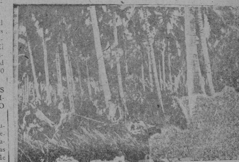
El paso de las tropas niponas en la jungla de Tulagi

Vichy. - El Código de familias francés ha establecido una prima pagadera en dos mitades a los matrimonios en el momento del nacimiento del primer hijo viable. Si el niño muere antes de 6 meses, la segunda parte de la prima solo se entrega en la fecha del nacimiento de un segundo hijo.