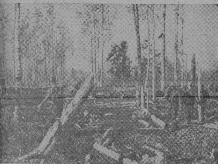
Bosque del Lago Ladoga. - Después de la batalla victoriosa de invierno, durante la cual 7 divisiones soviéticas fueron exterminadas. El fuego de la artillería ha destruido el bosque como una zona de fuego de tambor los países de la primera guerra mundial.