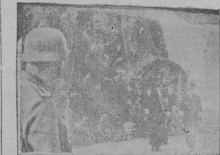
El gran almirante alemán Raeder, inspeccionando las defensas de la costa francesa, en las inmediaciones de Dieppe