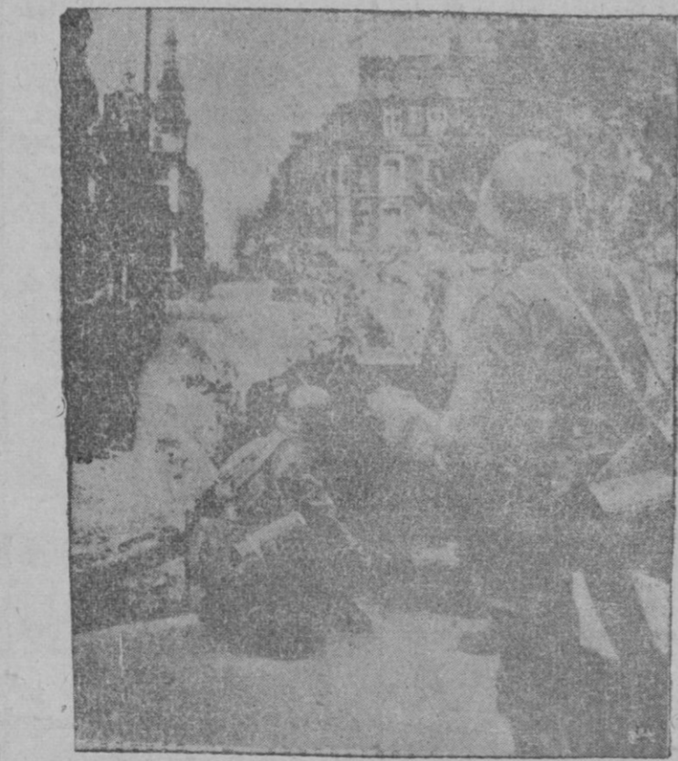
Los artilleros alemanos barriando con su fuego una de las calles de Dieppe