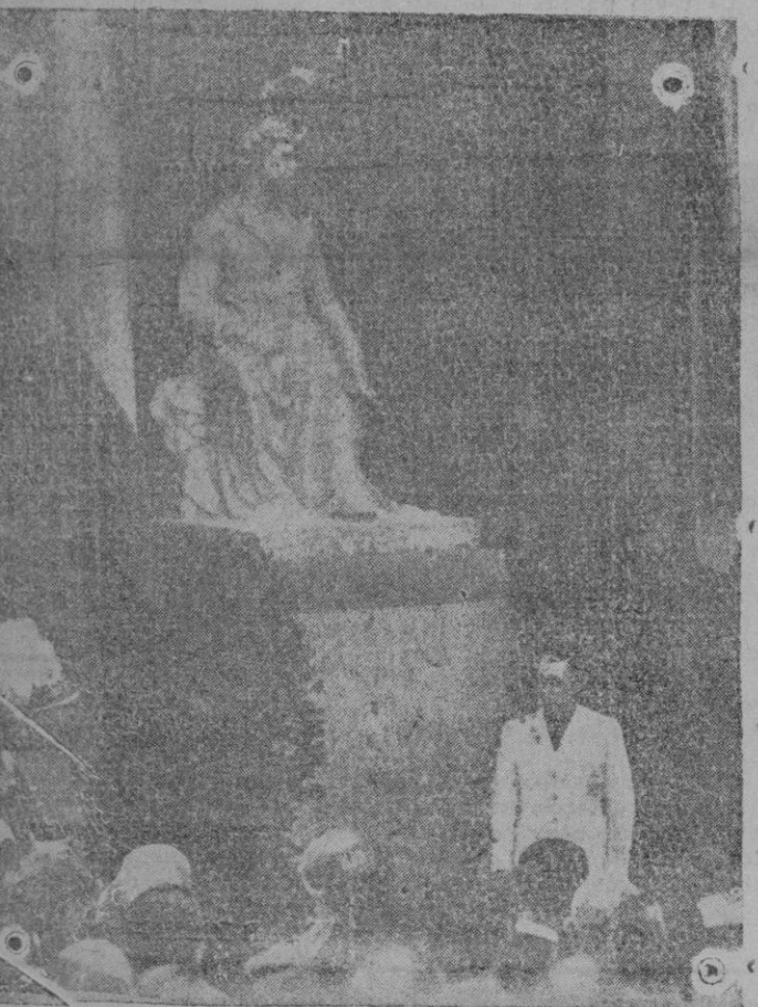
del descubrimiento en Barcelona de la estatua dedicada al pintor Forlín, en el momento en que el Gobernador Civil y Jefe del Movimiento pronuncia su elocuente discurso