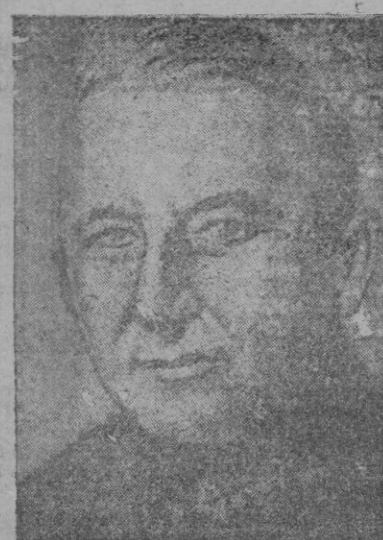
El general Ven Maunstein, el vencedor de Sebastopol