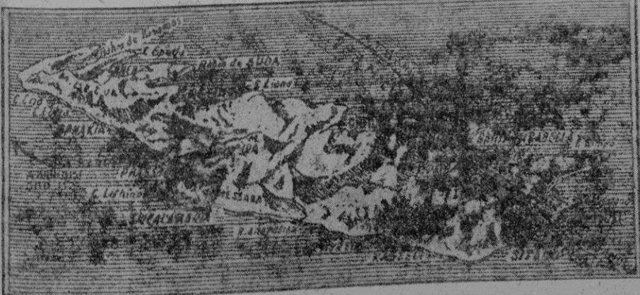
La isla de Creta, donde han podido arribar las fuerzas británicas de las que han abandonado Grecia, y el rey Jorge, único lugar de Grecia que no es territorio enemigo, según declaración inglesa.

Se encienden en el cielo las primeras luminarias, preludio de la espléndida iluminación de todas las constelaciones, para entonar así, como todas las noches, con su aereo titilar, el salmo del real Profeta: "Coeli enarrant gloriam Dei..."