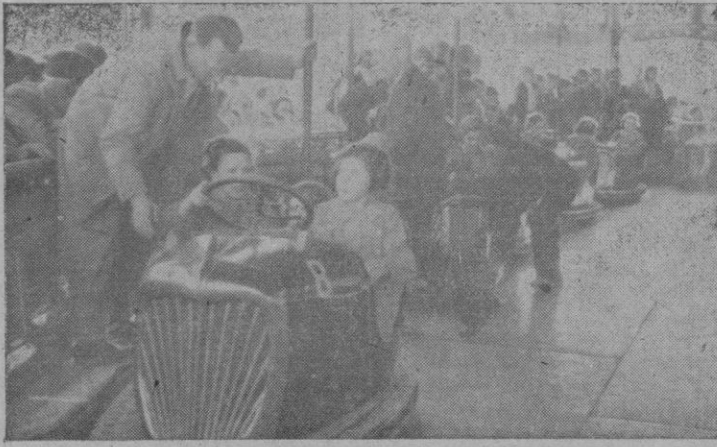
Los pequeños escolares en las atracciones