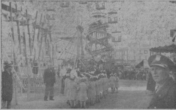
Los pequeños asilados dirigiéndose a disfrutar de las atracciones