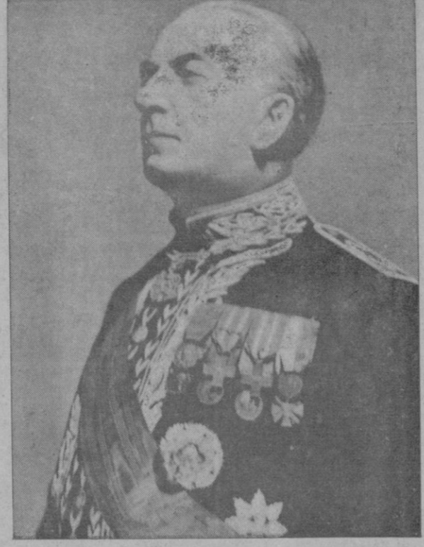
S. E. Luis Federzoni, Presidente de la R. Academia de Italia que acaba de llegar a España.