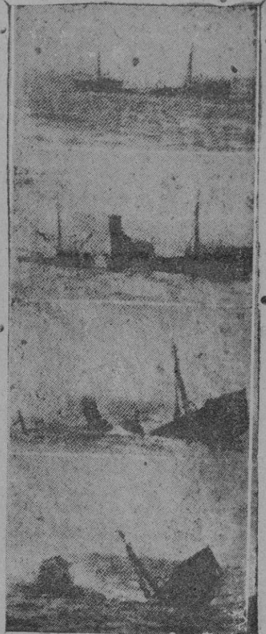
Cuatro momentos del torpedeamiento de un barco inglés por un submarino alemán

Camara: Eres pobre y no puedes compartir, un juguete? Escribe una carta a los Reyes y ellos te complacerán.