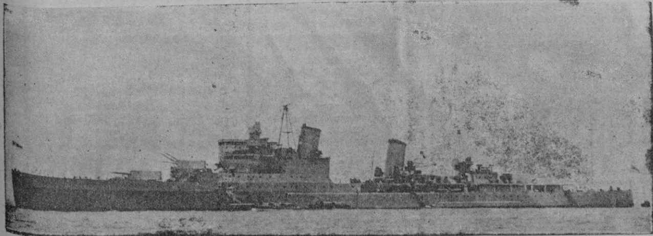
El crucero inglés "Soudampton" que de parte alemana se da como averiado por la aviación germana en la bahía de Firth of Forth, noticia desmentida por parte inglesa quien afirma en cambio que ha habido víctimas en su tripulación.

Berlín. — El comandante del submarino describió como sigue el hua-