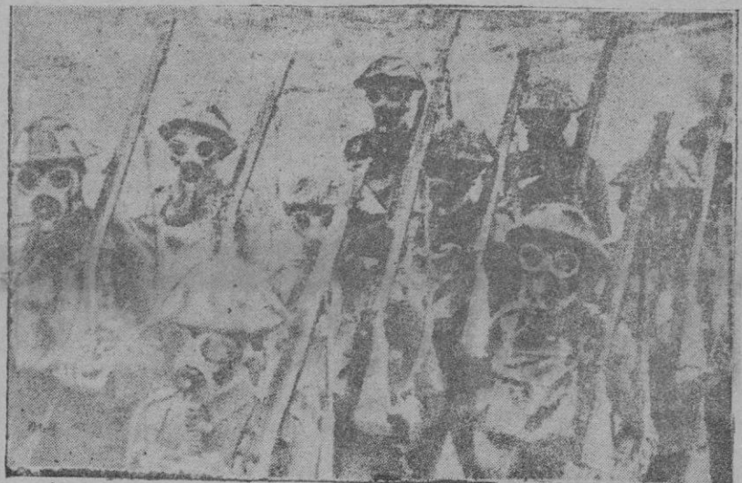
Aspecto de un destacamento inglés con el nuevo casco forrado en tela, y con la careta antigás

— "Estoy muy satisfecho de la marcha y los resultados de las negociaciones entre Alemania y la Unión Soviética que tuvieron como consecuencia el aclarar la situación territorial de Polonia y con ello la Europa Oriental. Estoy convencido del restablecimiento del orden y tranquilidad en estos territorios, de modo que constituirá una ventaja en be-