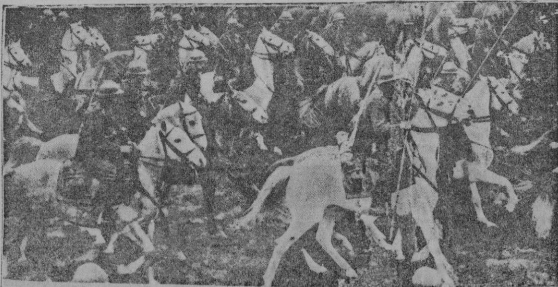
La caballería polaca que tan importante papel ha jugado en la guerra

créditos. (Esta es la cláusula llamada por los americanos de "Cash and Carry", es decir: "pagar al contado y llevarse").