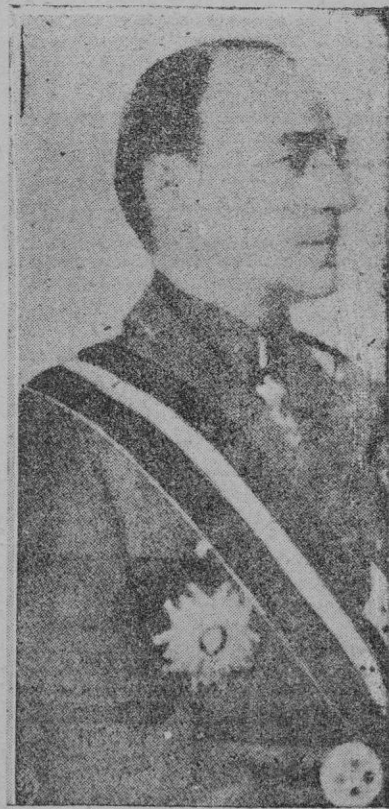
Calinescu, el Jefe del Gobierno rumano, asesinado

3. — Los beligerantes que adquieran mercancías en los Estados Unidos deben pagarlas por adelantado y transportarlas en sus propios barcos, quedando prohibida la concesión de