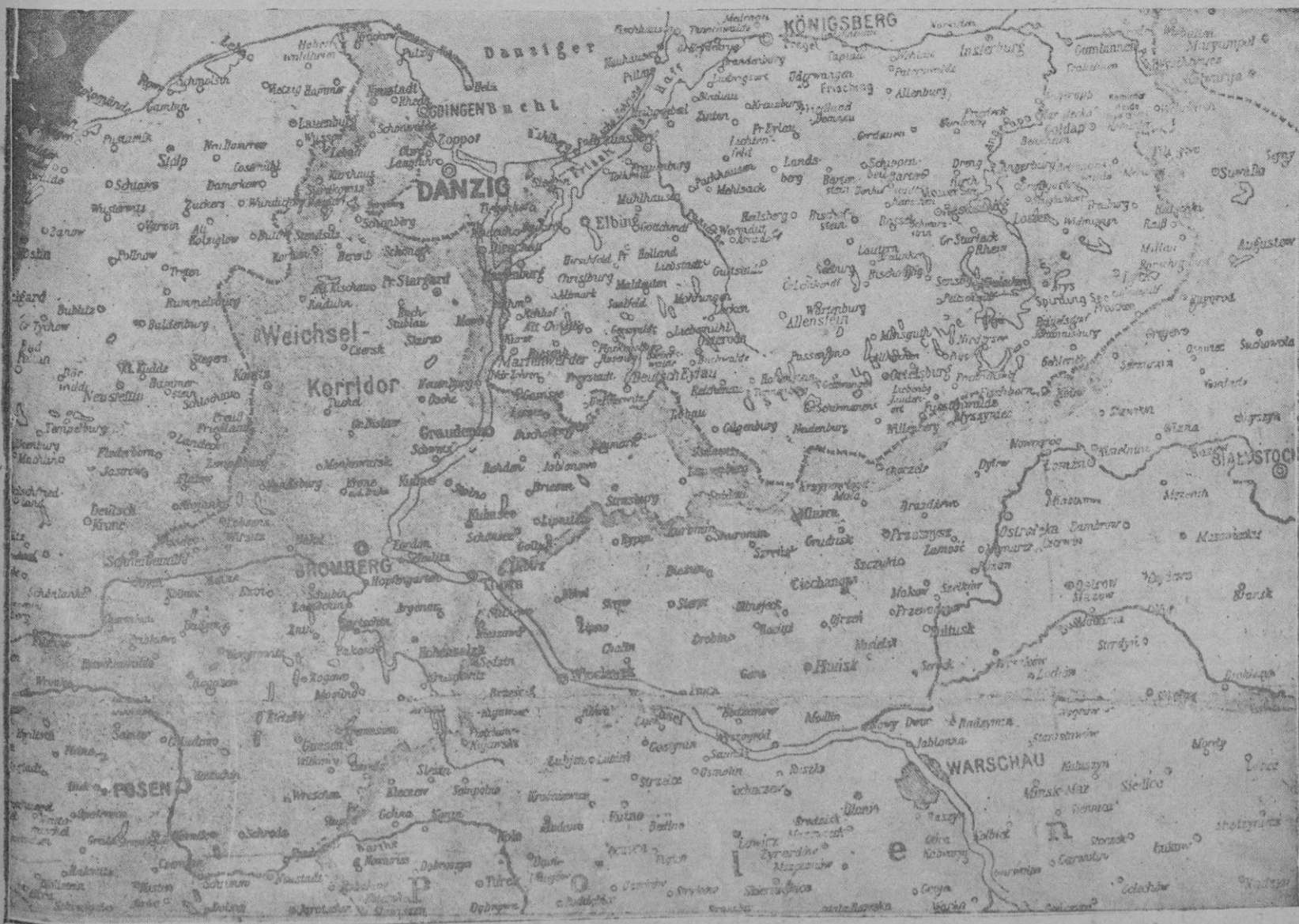
Mapa de la porción superior de Polonia, con el corredor de Dantzig y sus fronteras con Alemania y la Prusia oriental. (Mapa de un periódico alemán)

baratísimo un grupo luz eléctrico con 12 baterías 24 voltios 280 amperios poco uso plena marcha. un transformador de 24 a 120 voltios especial para radio. Darán razón en esta Administración.