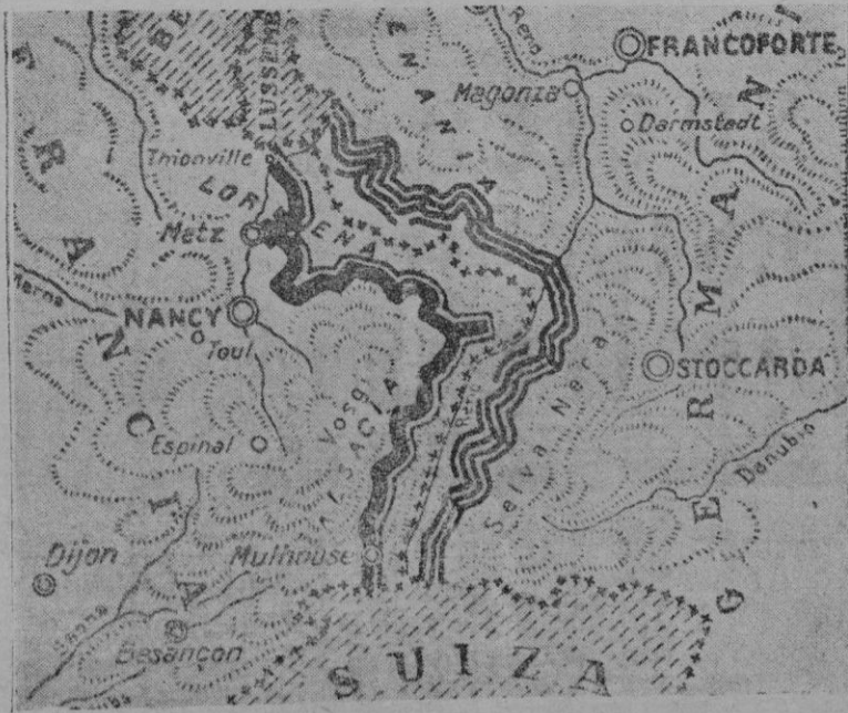
El frente occidental formado por la frontera franco-germana con las líneas Maginot y Sigfrido

Hitler se interesó por los heridos y hablando con ellos les pidió de qué manera habían sido heridos. Los heridos se mostraron encantados de la