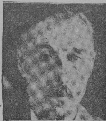
El embajador inglés en Berlín, Henderson, que tan importante papel ha jugado en las negociaciones entre el Führer y el gobierno inglés

En el referido comunicado se dice que el Führer dijo al Embajador francés que el Reich no podía tolerar más que se viajara en Polonia a los de raza alemana, y que deplora-