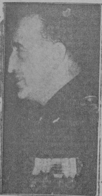
El Príncipe Colonna, Gobernador de Roma que acaba de fallecer