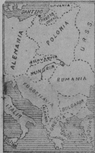
Parte de Europa donde están fijadas todas las miradas del mundo

A continuación, el Papa desde el balcón principal del Palacio de Castelgandolfo, dió su bendición papal.