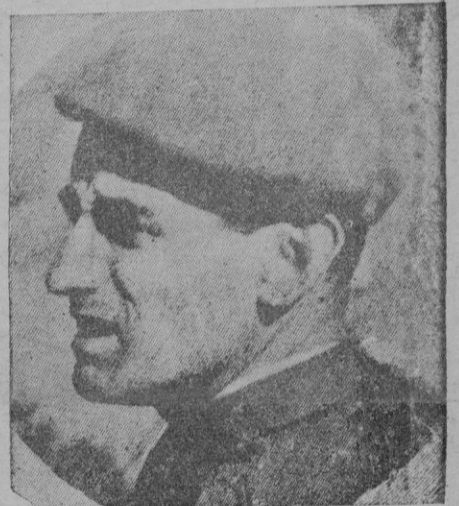
General don Agustín Muñoz Grande, Ministro del Partido