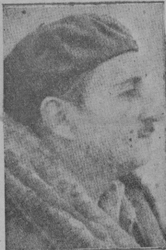
Don Luis Alarcón de la Las- tra, ministro de Industria y Comercio