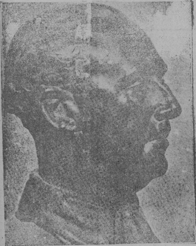
Generalísimo Franco, Presidente