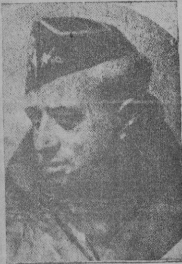
General don Juan Yagüe, Ministro del Aire