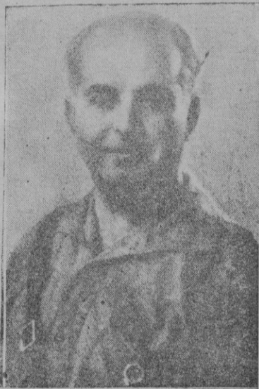
General don José Enrique Vare- la, Ministro del Ejército