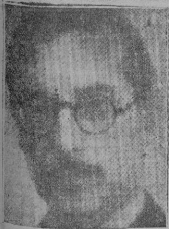
Coronel don Juan Beigbeder Atienza, Ministro de Asuntos Exteriores