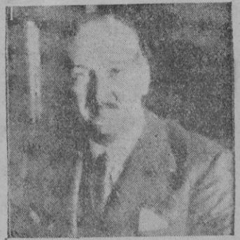
Don Alfonso Peña, Boeuf, Ministro de Obras Públicas