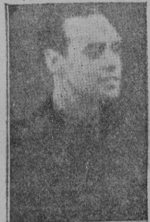
Don Pedro Gamero del Castillo, Ministro sin cartera