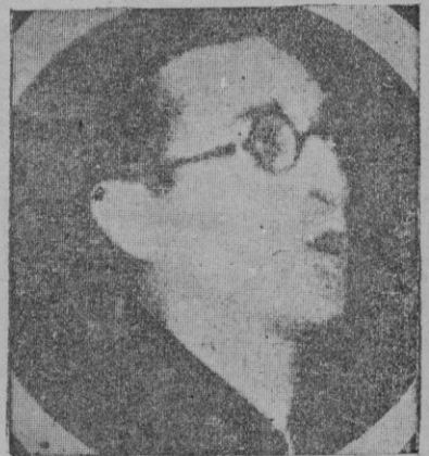
Don Rafael Sánchez Mazas, Mi- nistro sin cartera