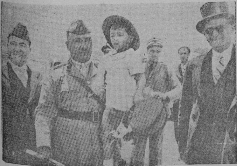
El niño Faisal II rey del Irak, en brazos de uno de sus ayudantes que le llevan a pasar las vacaciones estivales en el Líbano, región agitada con motivo de la entrega de Alejandreta a Turquía, que afecta a los pequeños reinos colindantes

Los que en tiempos de paz intencionadamente opongan trabas, comprometan o impidan ejercicios, trabajos u otros servicios ordenados por las Organizaciones de la Defensa Pasiva Antiaérea, o reservada o públicamente inciten a otros a no tomar parte en ellos o a no tener en cuenta los medios y medidas ordenadas por la Autoridad; en los casos que se conceptúan de poca gravedad, será castigado con la pena de prisión por tiempo de un o más años,