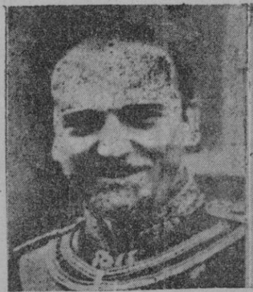
Dino Grandi, embajador italiano en Londres que ha sido nombrado ministro de Justicia