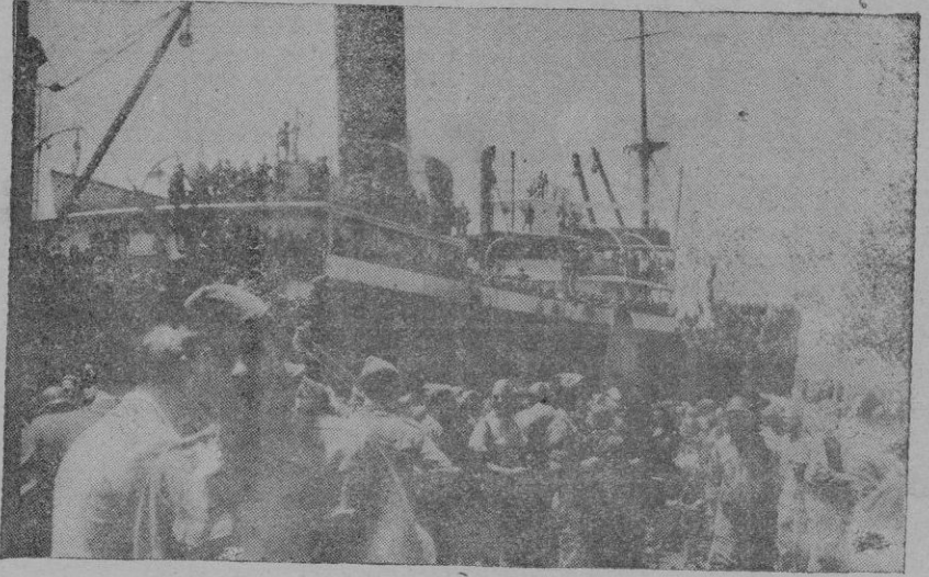
El vapor "Castillo de Simancas" que ha conducido a las tropas expedicionarias