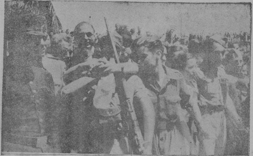
Los soldados al bajar a tierra son abrazados por sus familiares