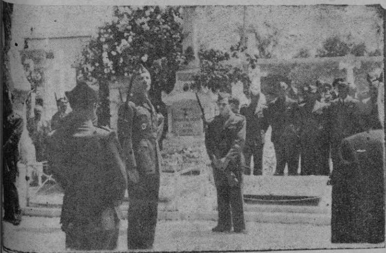
El homenaje en el Cementerio, a los aviadores caídos. — Rindien honores a las tumbas de los heroicos aviadores nuestros y legionarios, caídos por Dios y por España