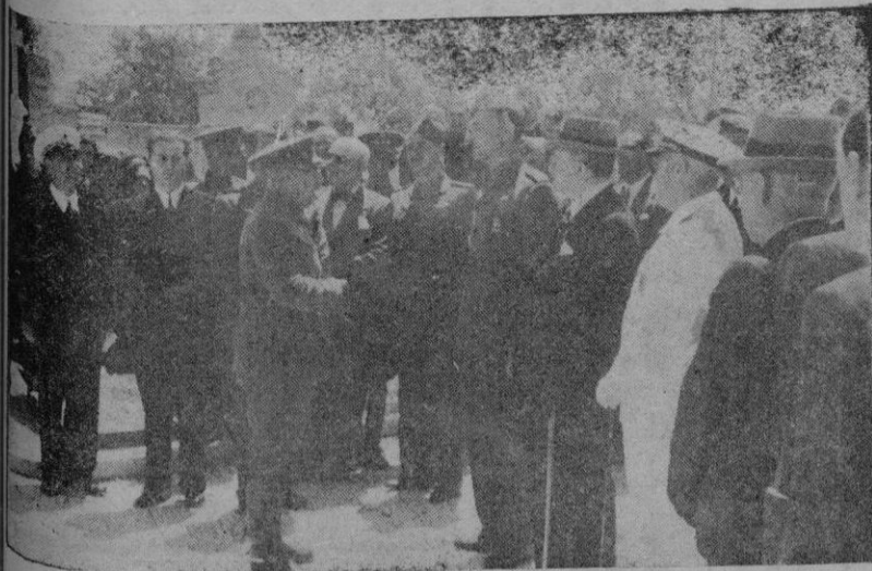
El Comandante General dirigiendo la palabra a los reunidos, con las Autoridades