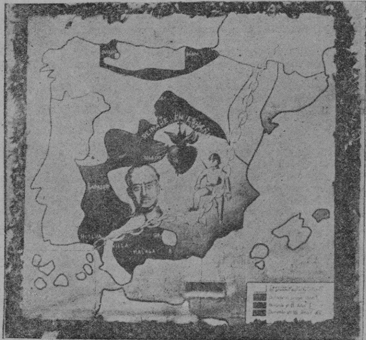
Fragmento luminoso que figuraba en la carroza presentada por el Batallón de Ingenieros, en la retreta militar

una vez, la haya leído podrá olvidar la indeleble escena de la muerte de Mónica, rodeada de sus dos hijos y de su nieto, el pequeño Adeodato y el llanto clamoroso del niño y las lágrimas calladas y tenaces de Agustín que ruedan por sus mejillas tostadas de nuda, ante el cadáver de la madre santa: "Cerraba yo los ojos de mi madre y entraba en mis entrañas una grande tristeza y salíame por los ojos vertiendo lágrimas...". Y no se avergüenza el magnánimo Agustín de este derretimiento de su corazón de carne; antes sale al paso de la dureza estoica de aquellos hombres venide-