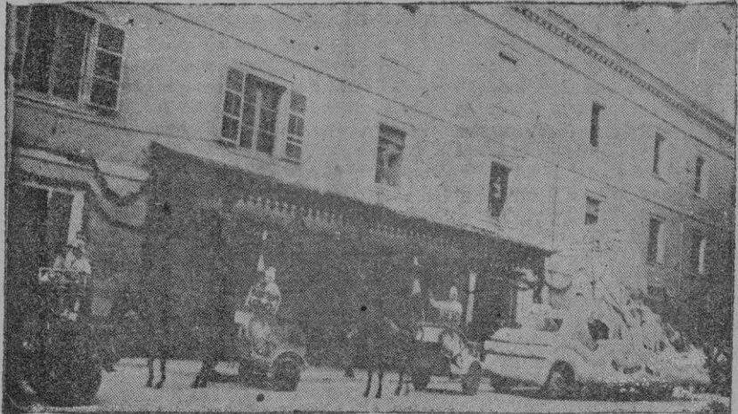
La carroza del Regimiento de Infantería, con los carros romanos que figuraban en la retreta militar

Y qué bella aparece Mónica, a través del velo de sus lágrimas! Y que suave, dibujada por la pluma de su hijo! En el tratado de las "Confesiones", la dulce figura emerge arreo en muchos trazos dispersos; pero con amorosísimo ahinco se complace el hijo de su sangre y de sus lágrimas en representarla en los cuatro últimos capítulos del libro noveno. Estos breves capitulitos son el panegirico más conmovido y bello que un hijo pueda pronunciar en loor de su madre, y alientan un calor blando y penetrante, calor tibio de nido, temperatura de leche reciente, suavidad de halda materna, combustión de óleos preciosos. Mónica, interpretada por su hijo, es la madre típicamente cristiana. Mónica tiene la ciencia del corazón y puede seguir la soberana mente de Agustín, en sus vuelos de águila teológica. Casada con un marido infiel (infiel en los dos sentidos del vocablo) ella consigue inhiertar el silvestre acebuche en la oliva fructífera y hacer retornar a su marido del desierto de los amores vagos a la santidad del tálamo único y fecundo. Ella doma las asperezas del marido colérico con su risueña e invencible paciencia. Ella deja las caras riberas de Cartago para andar en pos de las huellas errantes de su hijo. Y no duda en pasar el mar, aquel hosco mar profundo que no querían surcar las madres troyanas. ¿Quién, que sola