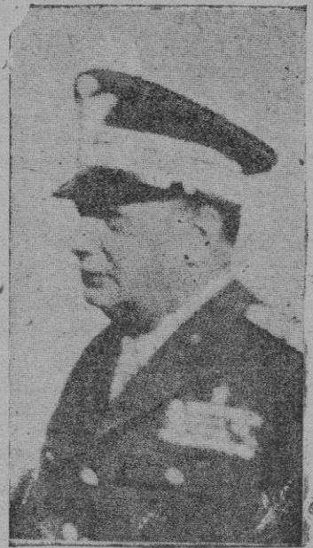
El general Guzzoni, jefe de las tropas italianas que han ocupado Albania

Soldados invencibles de Franco, hermanos de aquellos que antes de entrar en batalla se postraban en tierra y golpeaban con su guantelete de hierro, su pecho esforzado, implorando la protección de la Reina de las Victorias!. Soldados émulo de los de aquellos Tercios que ante los muros de Maestricht, suspendieron momentáneamente el asalto, al redoblar los atambores, para el rezo del "Angelus". Soldados españoles que ahora, en nuestra guerra de cruzada, habeis rezado en las trincheras, antes de arrollar al enemigo; los que en el avance prodigioso, doblasteis la rodilla en acatamiento a Dios, a la vista del Mediterráneo rescatado, en día de Viernes Santo, adorando al Redentor del mundo a la hora misma en que El inclinó su divina frente en lo alto de la cruz, soldados que en las fregatas de la guerra, rimabais las victorias de vuestro heroísmo, arrancando a vuestras guitarras airoas jotas, en loor de nuestra Pilarica; para vosotros es el agradecimiento de todos los españoles; para vosotros los cooperadores de nuestro excelso Caudillo, en la obra titánica de la estructuración de la nueva España, amasa-