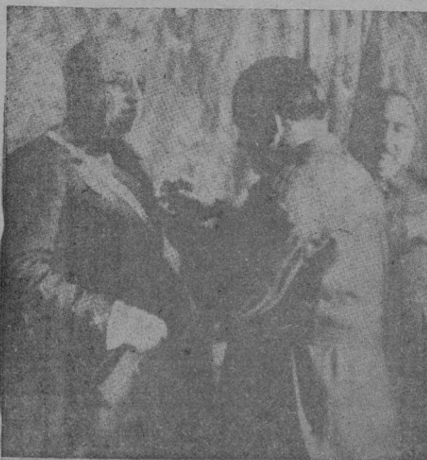
El General Gambara condecorando al General Moscardó con la medalla honorífica, concedida por S. M. el Rey Emperador de Italia