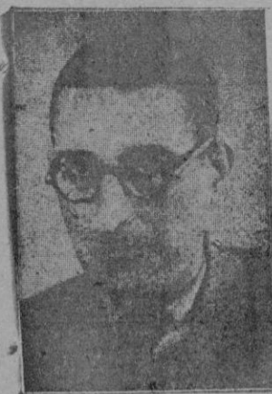
Rafael Sánchez Mazas que hoy hablará en Zaragoza

Dispuesto a salir, al cruzar la principal galería frente a una de las puertas que dan acceso a la escalera, observé que delante de mí caminaba despacio una señora, de cabellos gri-