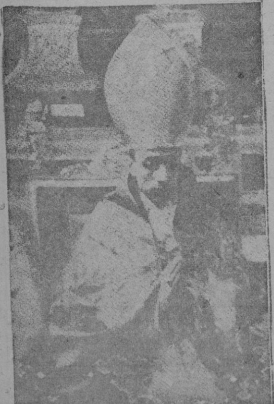
S.S. el Papa Pío XII

Innumerables coches ocupados por misiones especiales, embajadores extraordinarios, legaciones extranjeras, diplomáticos y numerosos patriarcas, entre ellos el de Roma, etc., pasan dirigiéndose a la Basílica para asistir a las fiestas de la coronación del Sumo Pontífice.