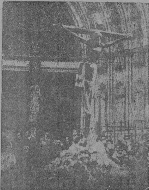
La imagen venerada saliendo de la Catedral de Barcelona