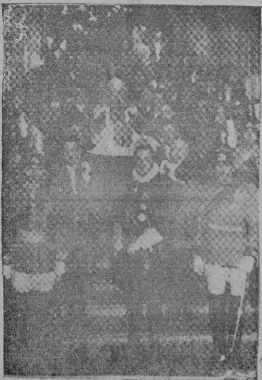
Los restos de Pío XI al ser trasladados a la Basílica de San Pedro

Van llegando a la Ciudad del Vaticano todos los cardenales con objeto de asistir al cónclave que como se sabe ha de celebrarse después de las honras fúnebres en sufragio del alma del Santo Padre y del cual por escrutinio del que tienen que alcanzarse las dos terceras partes, será elegido nuevo Papa.