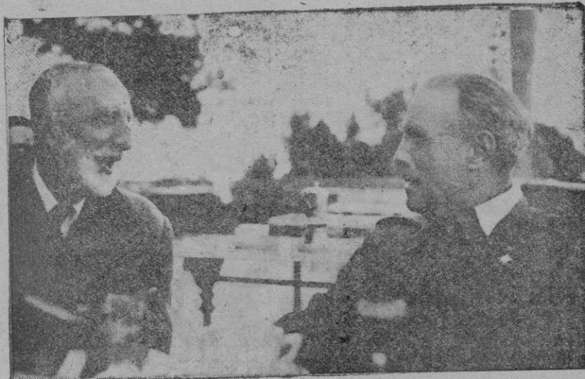
El ilustre general Solchaga hablando con nuestro redactor Tous y Maroto en la terraza del Victoria

Solchaga! A sus relevantes méritos, a su genio militar, a sus resonantes triunfos, engarzaba entonces la nota paternal, el cariño a sus soldados, el recuerdo a los héroes anónimos que a sus órdenes lucharon ofrendando a España su sangre generosa. No es extraño, que con esta compenetración, vayamos de triunfo en triunfo, asom-