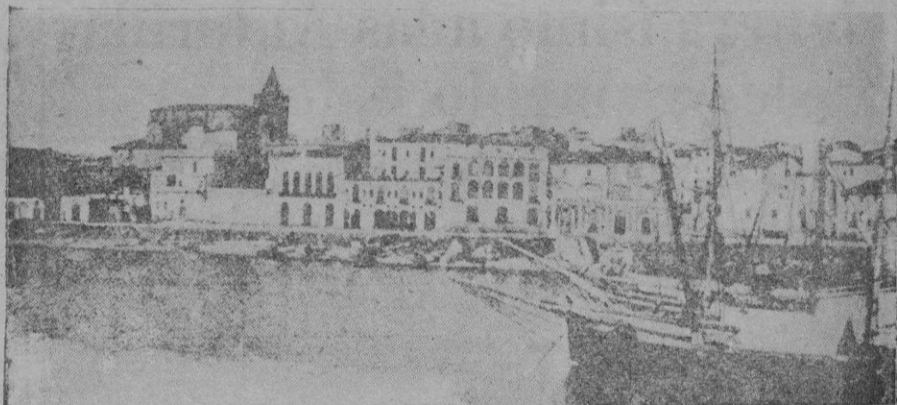
Vista general de Palamós

Además de los pueblos mencionados en el avance del parte, se han ocupado en el sector de Berga los de Figols y San Cornelio y entre este sector y el de Vich el de Borredá, el vértice Cañellas y Pla de la Lluça. En el sector de Vich, los pueblos de San Martín de Sescors, Santa María de Casco y Can Toni. En el de Gerona, los de San Hilario de Sacalm, Osor, Anglés, Vilana, San Estany, Montfulla, Salt y Santa Eugenia, ha-