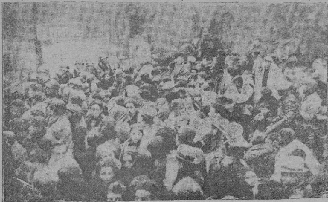
En la frontera francesa. — Ante el pueblo de El Perthus se amontonan los fugitivos de España, unos engañados y otros, para burlar la acción de la justicia