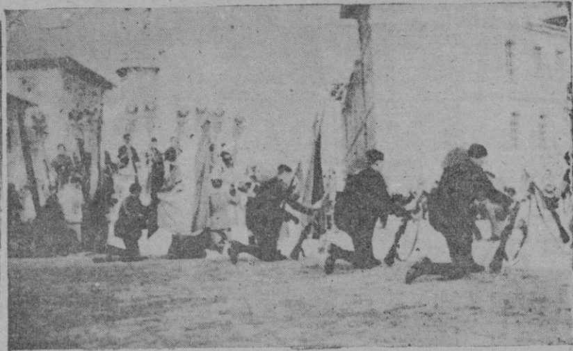
La misa de campaña celebrada ante la estatua de Ramón Lull

Para el desfile se colocaron el Padre Ma