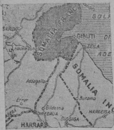
La situación geográfica de Gibuti, en relación con Etiopía, ciudad cuyo nombre suena mucho ahora como el de Túnez y de Niza

obras a realizar en la acera de la plaza Olivar, por dicho señor.