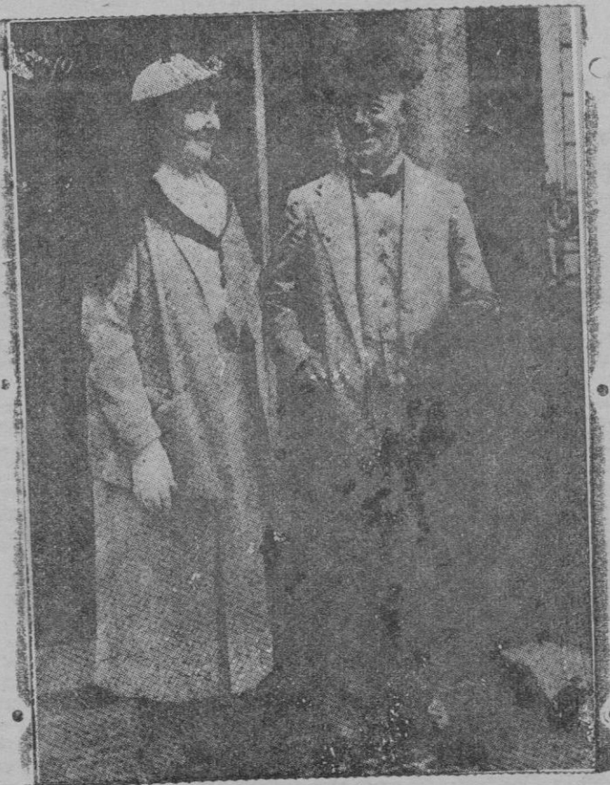
Lord Runcimann y su esposa, al salir de Londres para dirigirse a Checoslovaquia, con la delicada misión que le ha conferido Mr. Chamberlain

Lo que puedo decir es que el nuevo Estado, tiene el afán de llevar hasta los límites posibles y razonables, la protección a las clases trabajadoras y que una de las manifestaciones más eficaces de esta protección es la de seguros sociales.