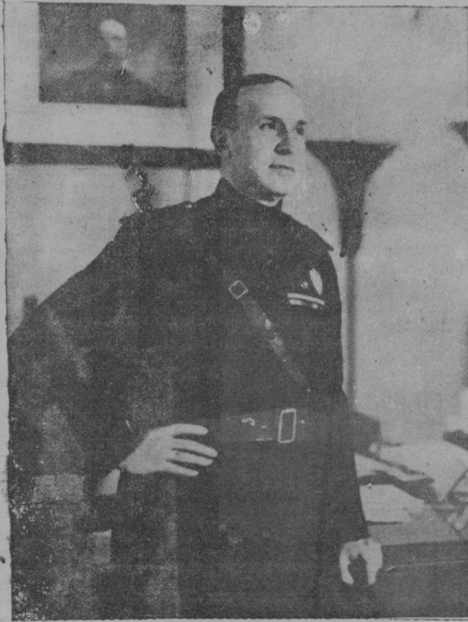
Dino Alfieri, Ministro de Cultura, de Italia, a cuya alta dirección están encomendados los servicios de prensa de la nación hermana

Precisamente por eso atribuía dicha prensa, desde el primer instante, al heroico gesto de los patriotas españoles, un significado y una trascendencia que superaba las fronteras de nuestra Península y hacia depender de su resultado final las suertes de la civilización latina y mediterránea. La prensa fascista adivinaba, por tanto, desde entonces, que los campos de batalla iban a trocar en el palenque dirimente de opuestas ideologías