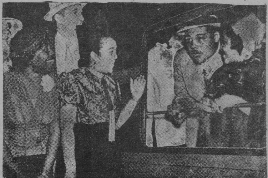
El boxeador Joe Louis con su esposa, despedidos por gente de color, que les felicita por el triunfo de aquél sobre Schmeling