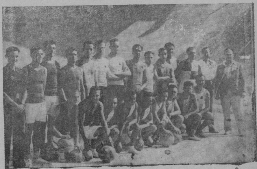
Los equipos militares de Basketball, que el domingo jugaron en el Velódromo de Tirador a beneficio de Frentes y Hospitales

(1) En los colegios de los Jesuitas, para estímulo de los escolares, están éstos divididos en dos bandos: romanos y cartagineses, en constante lid intelectual.