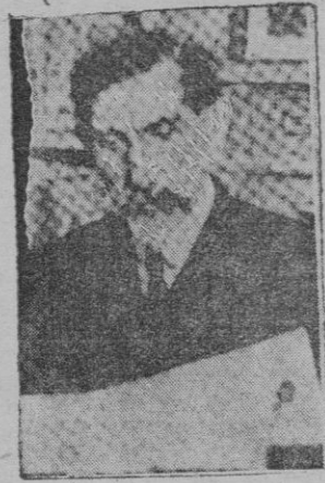
Carlos Maurras, el Director de "Acción Francésa" que ha sido elegido miembro de la Academia Francesa

Otra gran Empresa, solicita detalles para dar forma a un magno proyecto de poner a disposición del General Jefe de los Caballeros Mutilados 300 establecimientos para la venta de determinados artículos, que se-