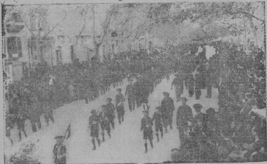
El desfile por el Paseo del Generalísimo Franco (antes Borne)