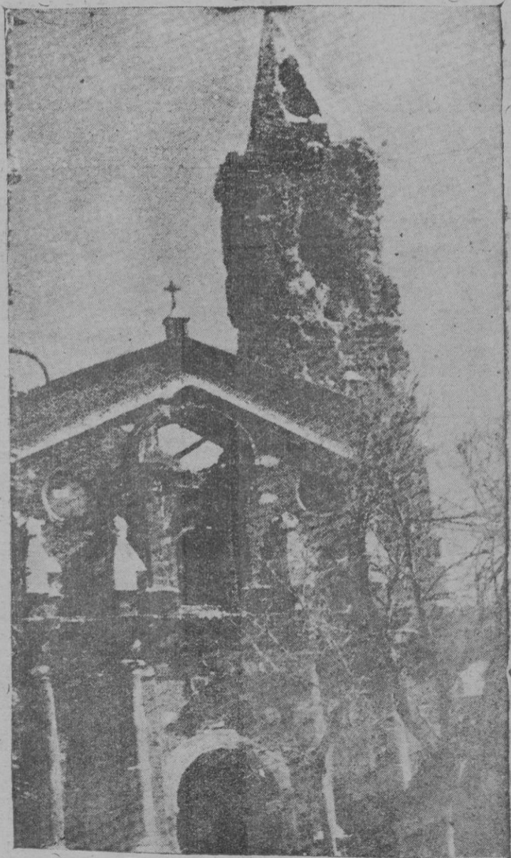
Estado en que fué encontrada la iglesia parroquial de Belchite después del bárbaro dominio de los rojos