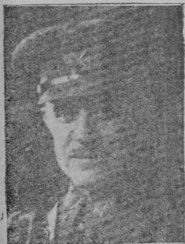
El vice-presidente del Consejo y Ministro del Exterior General Jordana

homenaje a aquellos más notables artistas imagineros cuyas prestigiosas obras lograron salvarse de los atentados, siendo el más rendido el tributado por Sevilla a Martínez Montañés que ofreció la cultura de una época en toda su hermosa magnitud y exaltación artística. Las imágenes y retablos de Montañés siempre habían sido respetados y venerados por el pueblo que los reverenciaba con el cantar popular; la clásica saeta rápida, cortando el aire en la noche del Jueves Santo que llega a penetrar en