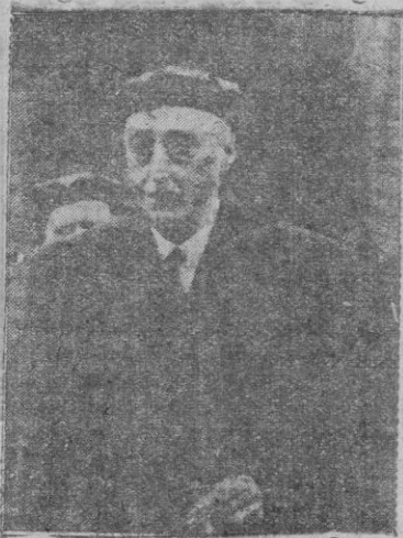
El ministro de Justicia, Conde de Rodezno

Se extiende en otras consideraciones y pide la colaboración de todos. Hace pública ratificación de las aspiraciones de Falange y ofrenda todo su entusiasmo al Caudillo. Dedicar un