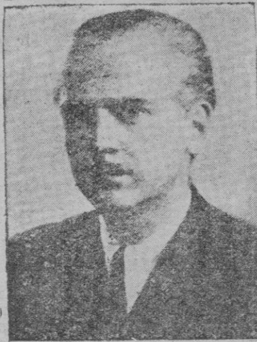
El Ministro del Interior Señor Serrano Suñer

Mientras va realizándose esa tarea difícilísima de formar el inventario de lo destruido, España culta rinde