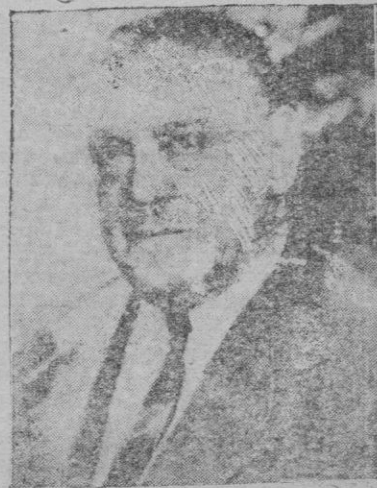
El ministro de Orden Público, General Martínez Anido

Desconsoladora es la contemplación de la ruina que en este aspecto del Arte sufre España, por obra y sistema de una locura colectiva que no guarda precedentes en el mundo civilizado, no precisando repetir --por haberlo ya reproducido-- lo que arroja el balance de tanta salvajada, ni citar las poblaciones que fueron más castigadas por la destrucción, hasta el