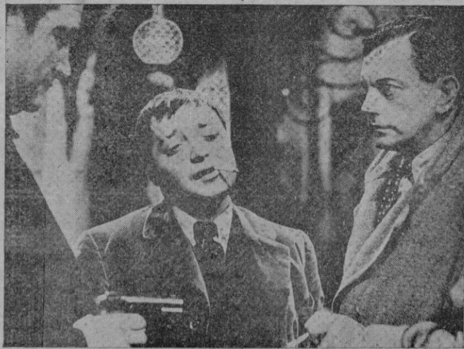
Una escena del emocionante film

Persistió el mal tiempo, la niebla especialmente en los campos donde se lucha y ello fué motivo de que las operaciones no alcanzasen el ritmo de